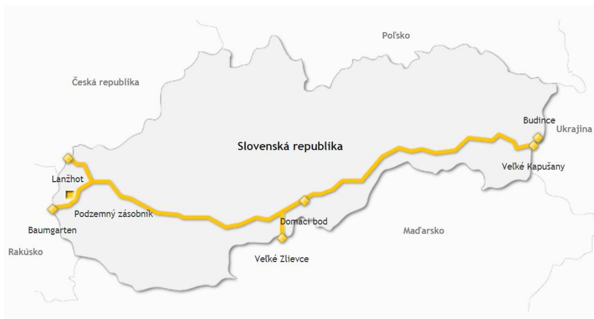
Obrázok č. 1 – Prepravná sieť spoločnosti eustream, a.s.

Na základe rozhodnutia príslušného výboru – Rozhodovacieho výboru na vysokej úrovni – v októbri 2019 nebol projekt Eastring zaradený na štvrtý zoznam PCI. EK navrhla ponechať projekty prepojenia CZ – PL, BACI ako aj Eastring mimo zoznamu PCI a zaradiť na zoznam PCI ako jediný dodatočný projekt LNG terminál v Gdaňsku. Pri projekte BACI zdôraznila potrebu pokračovania hľadania riešenia pre integráciu trhov, aj v nadväznosti na pilotný projekt TRU a pri projekte Eastring pripravenosť na budúci dialóg o prínosoch projektu.