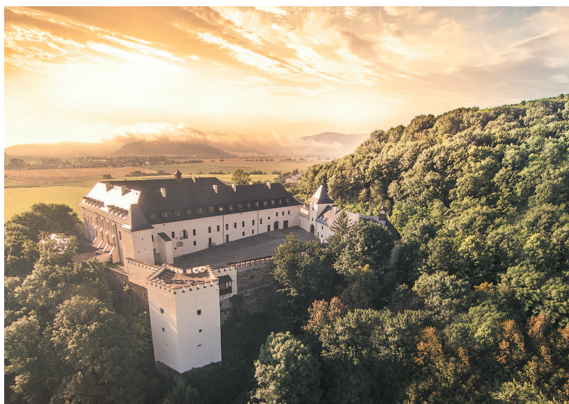
Viglašský zámok rekonštruovali podľa dobových záznamov.

O význame podpory investovania do inovácií vo výrobe svedčí aj fakt, že v podporených podnikoch boli zaznamenané priemerné nárasty tržieb