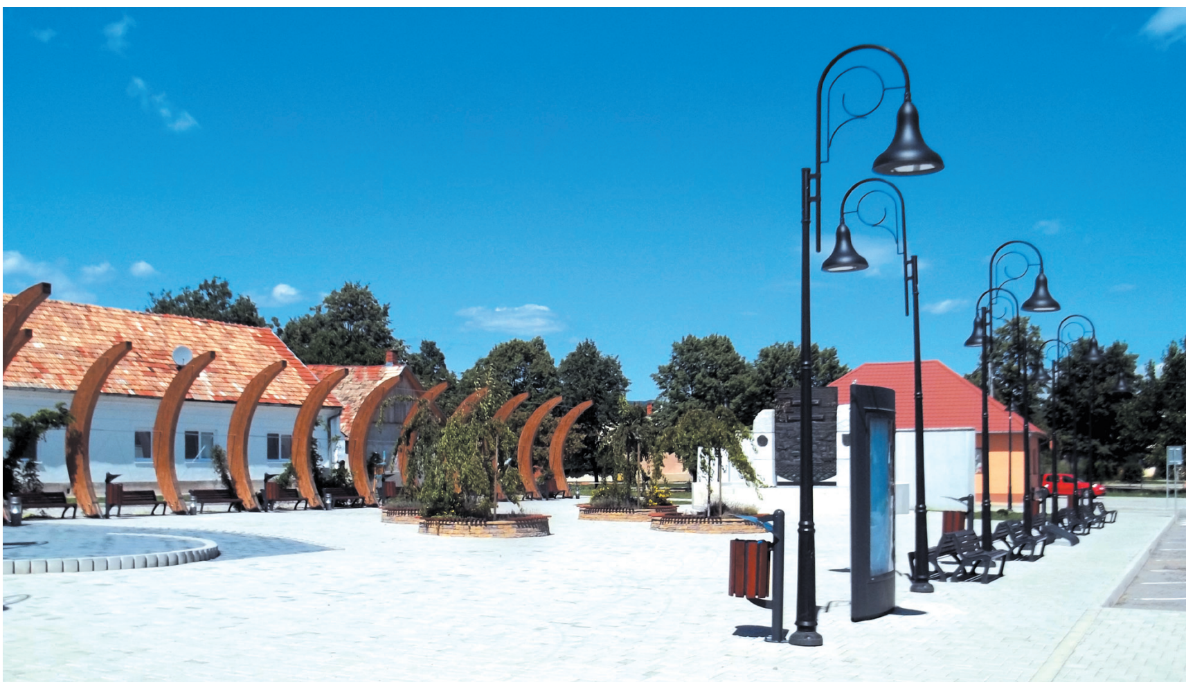
Nová vetva verejného osvetlenia vybudovaná v revitalizovanom centre obce.

V roku 1931, ako v prvej obci vtedajšieho Zlatomoraveckého okresu, sa uskutočnila elektrifikácia obce Kozárovce. Pouličné lampy sa rozsvietili večer 8. mája. Odvtedy, až do modernizácie verejného osvetlenia realizovanej v roku 2010, sa uskutočnilo viacero úprav a technických zmien.