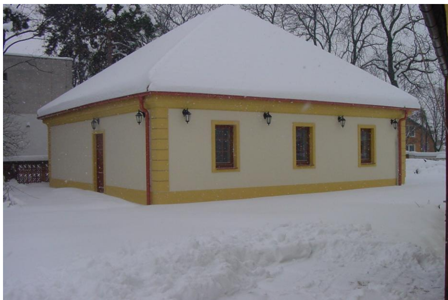
Ten istý pohľad, stav po ukončení a kolaudácii v roku 2012.

Doprava bola zabezpečovaná výlučne osobným motorovým vozidlom VW Caddy, najjazdené 340.000 km, výnimočne Daewoo Nexia, najjazdené 310.000 km. Obe vozidlá majú relatívne vysoký počet najjazdených km, preto bolo zrealizované, plánované obstaranie nového motorového vozidla Mercedes Benz Vito, ktorý svojimi parametrami plne vyhovuje aj na prevoz stredne veľkých a menších výstav, či bezpečný prevoz predmetov v rámci akvizícií. Dopravu bude treba objednávať v budúcnosti len veľmi ojedinele, alebo vôbec nie.