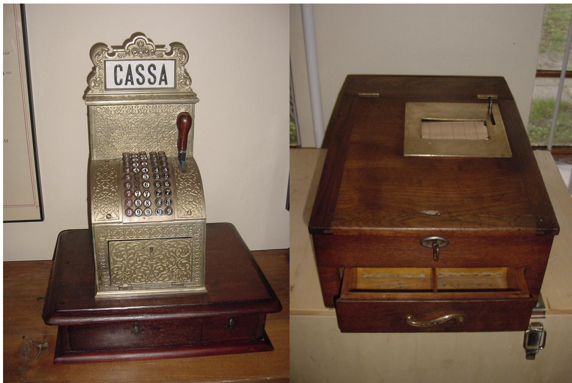
Zreštaurované predmety pre výstavy v roku 2009: veľmi vzácna registračná pokladňa“ Prvej Rakúsko-Uhorskej továrne na registračné pokladne“ a drevená registračná pokladňa „National“

g) Odborno – metodická, lektorská činnosť, spolupráca s inými inštitúciami.