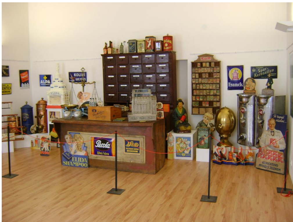
Výstava „Ráče vstúpiť, čím poslužime?“ – Michalovce