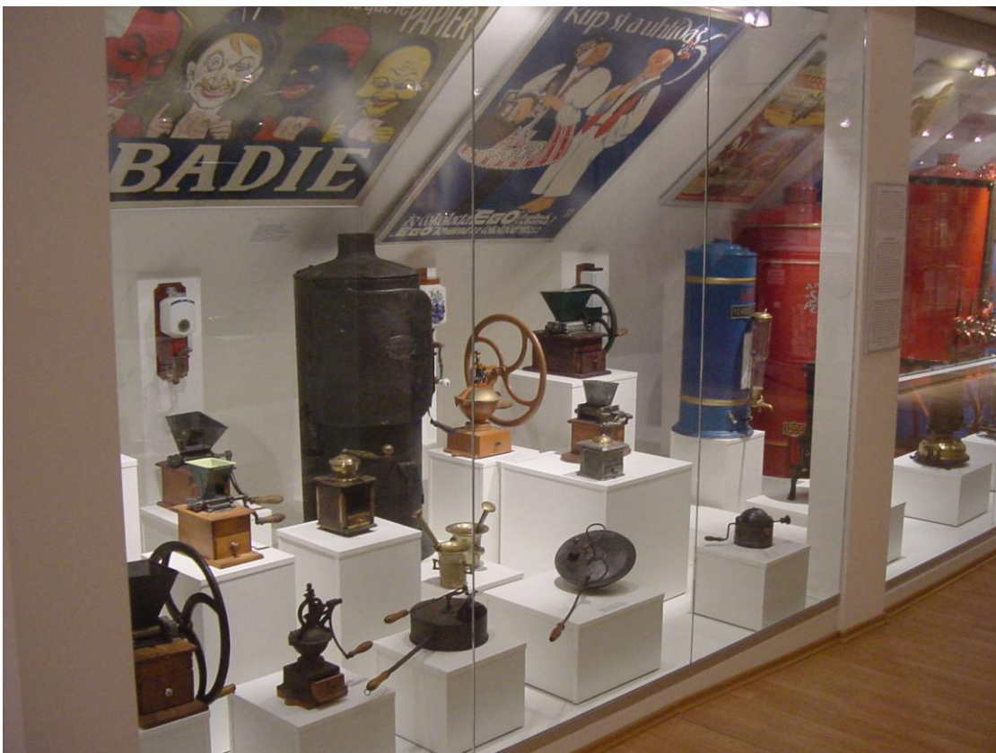
Stála expozícia – pomôcky na úpravu tovaru .