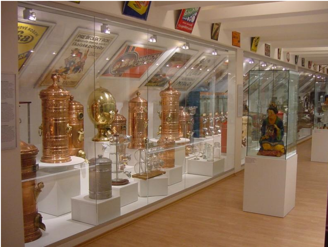
Stála expozícia – zásobníky na tovar