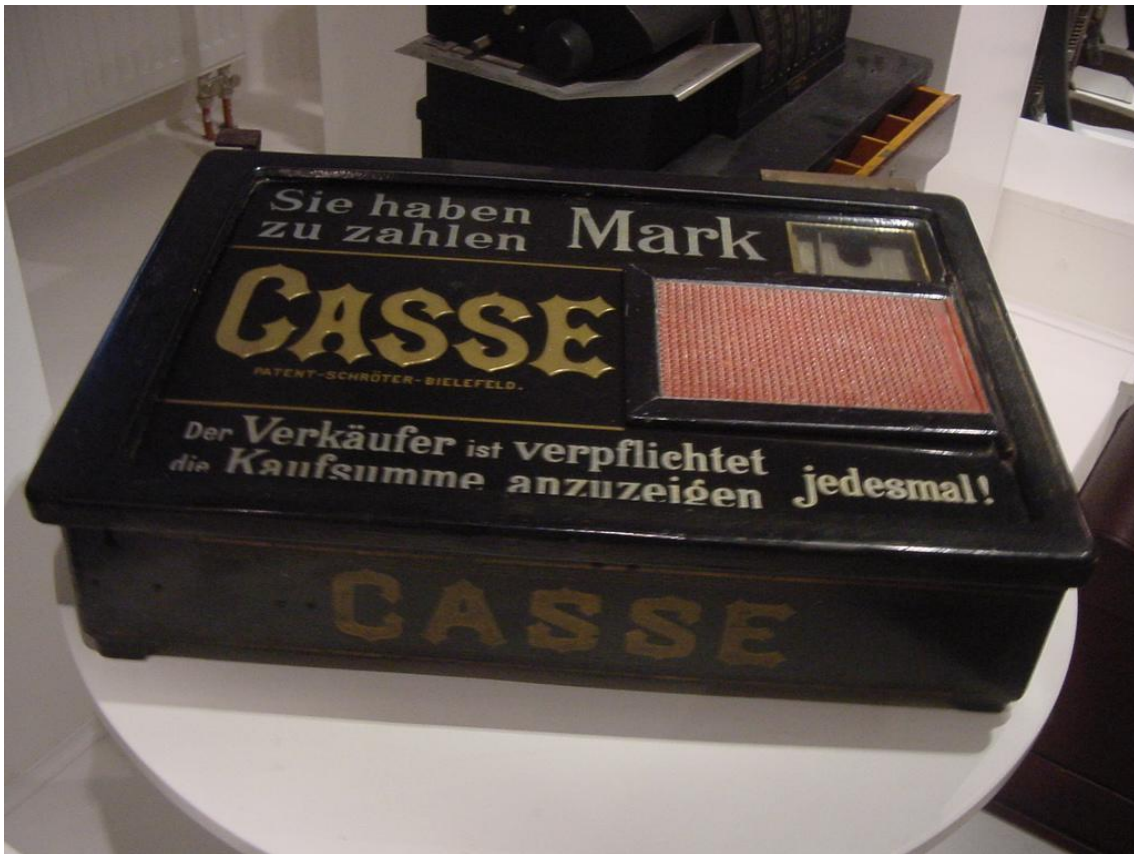
Predmety z akvizície v roku 2009 – veľmi vzácna a unikátna registračná pokladňa „Merkur“