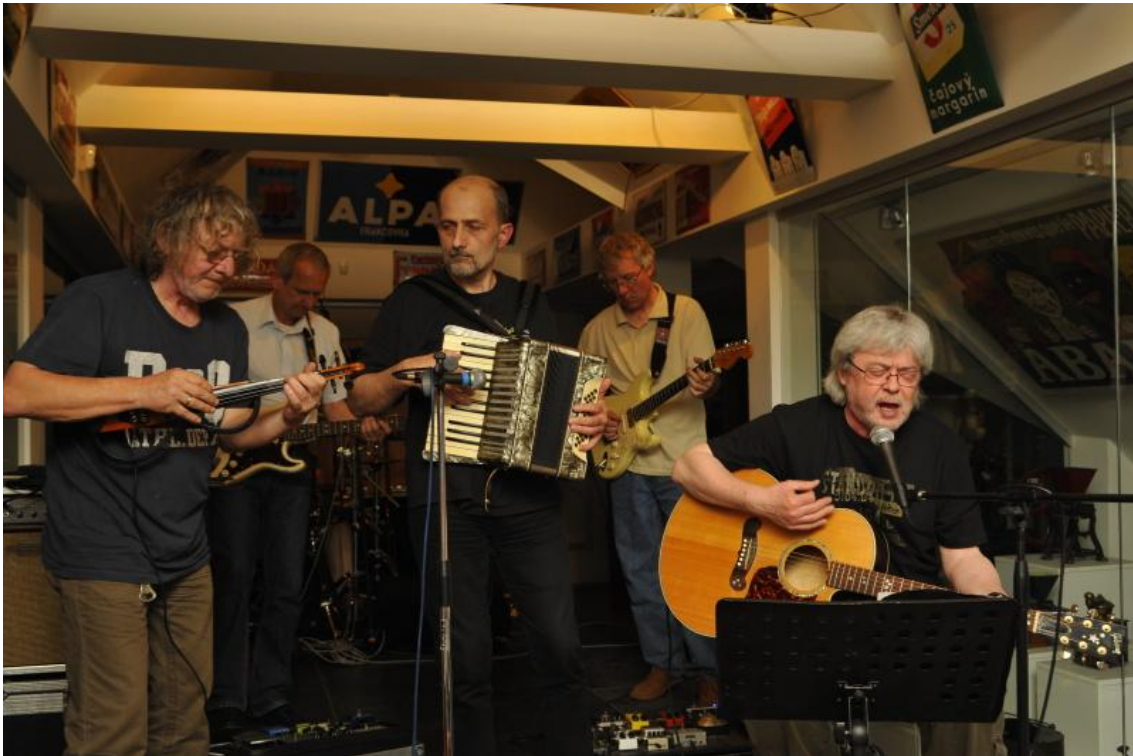
„Rock v múzeu“ – legenda československého big-beatu z Prahy, „Vladimír Mišík a Etc.“ v MOB.