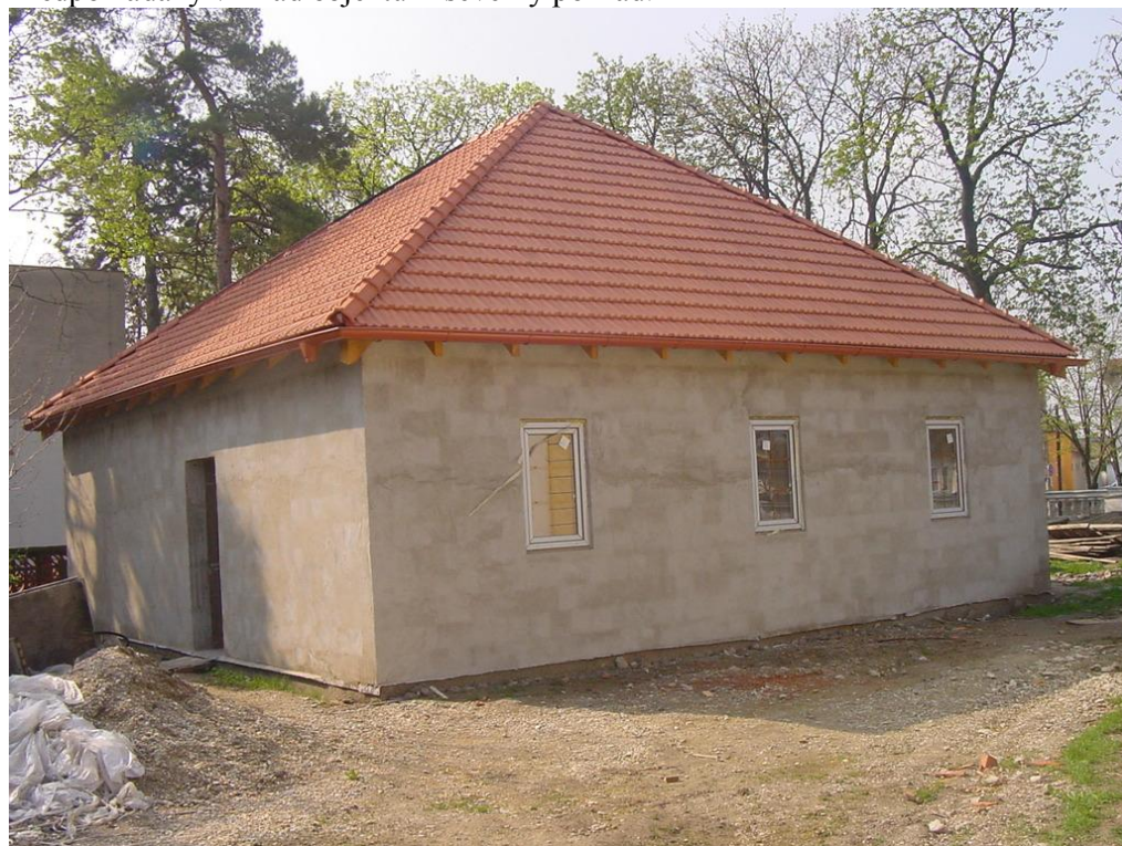
Ten istý pohľad, stav po prácach zrealizovaných v roku 2009.

Doprava bola zabezpečovaná výlučne osobným motorovým vozidlom VW Caddy, výnimočne Daewoo Nexia. Bol zakúpený 1 nový PC. Na nádvorí múzea je, ako v jedinom múzeu inštalovaný v spolupráci s občianskym združením Medikumpolis, verejný, internetový, informačný terminál „Surf point“, na ktorom sa môžu návštevníci pripojiť na stránky mesta Bratislava, častí Jarove, Rusovce, Čunovo, Ružinov, miest Hainburg, Malacky, Veľký Meder, ZUŠ na Exnárovej ul. v Bratislave a stránky občan, Úrad vlády, Prezident, Živnostenský a obchodný register, Profesia, Európska Únia, tel. zoznam pevných liniek, cestovné poriadky autobusovej a vlakovej dopravy, ďalej je možné odosielať a prijímať e.mail. Múzeum obstaralo, pre zvýšenie úrovne realizácie projektu „Rock v múzeu“ špeciálne osvetlenie pre