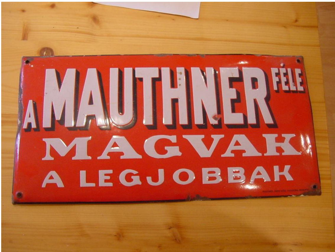
Predmety z akvizície v roku 2009 –kovová smaltovaná tabuľa semenárstva „Mauthner“