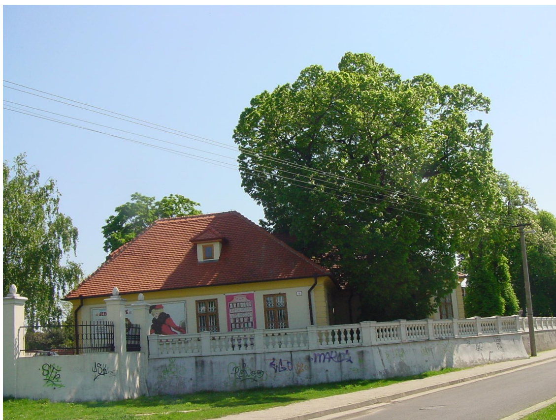
Múzeum obchodu Bratislava