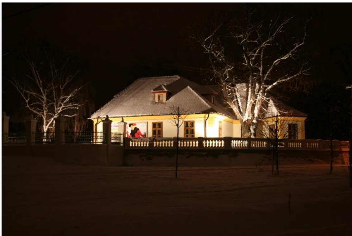
Múzeum obchodu Bratislava

evidencia, katalogizácia, kategorizácia, či podrobné vedecké spracovanie. Zbierkový fond múzeu prezentuje najmä výstavnou činnosťou, či už prostredníctvom stálej expozície, alebo špecialitou Múzea obchodu – putovnými výstavami na Slovensku a v Českej republike. Novou formou prezentácie je aj fungovanie múzea, ako hudobného klubu. Koncerty projektu „Rock v múzeu“ sa odohrávajú priamo v stálej expozícii, či v exteriéri múzea. Fond sa nepriamo prezentuje aj prostredníctvom spolupráce so subjektmi reklamy, filmu, či obchodu. Ďalšou formou je publikačná činnosť. Múzeum uzatvorilo Dohodu o kultúrnej spolupráci s Mestským múzeom v Králikoch a Dohodu o spolupráci s firmou Obchodní a kupecké museum s.r.o. z Českých Budějovic o stálej expozícii v Českom Krumlove.